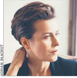
DANUTA STENKA aktorka