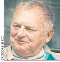
JERZY GRUZA reżyser, scenarzysta