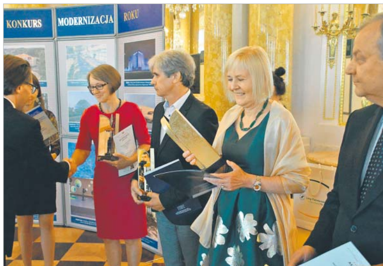
← Kategoria: Obiekty użyteczności publicznej. Nagroda dla Komunalnego Zakładu Gospodarki Mieszkaniowej w Katowicach za modernizację, rozbudowę i adaptację budynku mieszkalnego na usługowo-biurowy, ul. św. Jana 10 – Katowice.