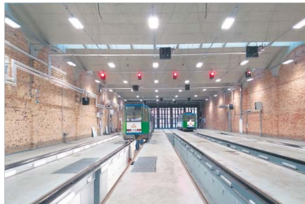
♦ Zajezdnia Pogodno w Szczecinie

TRAMWAJE I KOLEJ | Grupa ZUE zgłosiła do konkursu dwie inwestycje – przebudowę obiektów zajezdni Pogodno w Szczecinie oraz wykonanie robót budowlanych w ramach projektu polepszenia jakości usług przewozowych poprzez poprawę stanu technicznego linii kolejowych na odcinkach Zawiercie-Dąbrowa Górnica i Ząbkowice-Jaworzno Szczakowa.