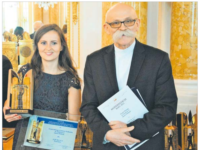
← Kategoria: Obiekty hotelarsko-turystyczne. Nagroda dla Arche Sp. z o.o. Warszawa za modernizację Zamku Biskupiego przy ul. Zamkowej 1 w Janowie Podlaskim.