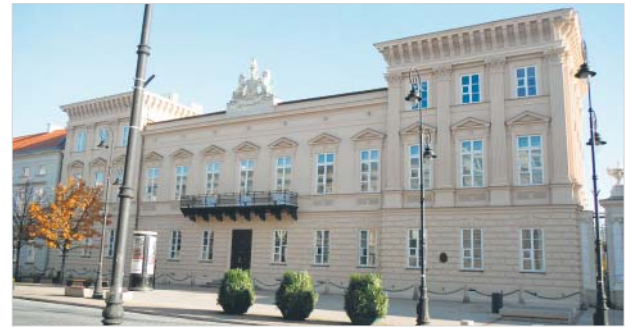
Dzięki rewitalizacji pałac odpowiadającego dla rangi miasta, w jakim jest zlokalizowany, prowadzony został do standardu

Prace związane z dostosowaniem obiektu do obowiązujących przepisów przeciwpożarowych zaprojektowało biuro projektów L3 SYSTEM Andrzej Kowalczyk z Warszawy, a wykonała je firma Marek Krajewski MARKBUD z Warszawy.