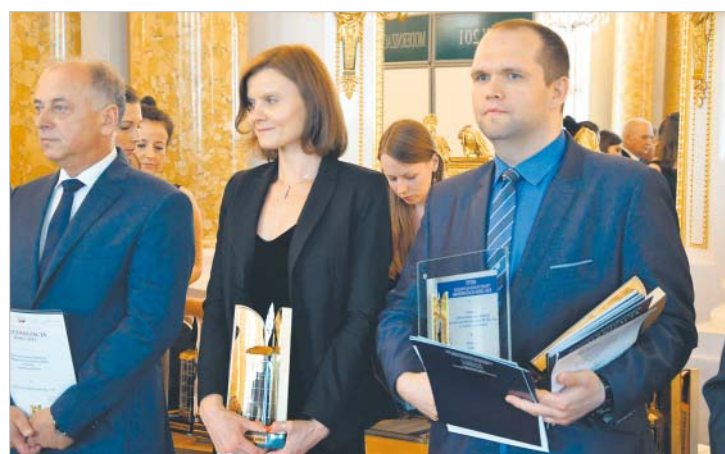
← Kategoria: Obiekty ochrony środowiska. Nagroda dla MPWiK we Wrocławiu za przebudowę budynku technologicznego, chemicznego pod budowę Stacji badawczej na terenie ZPW Mokry Dwór, ul. Na Grobli 14-16 we Wrocławiu.