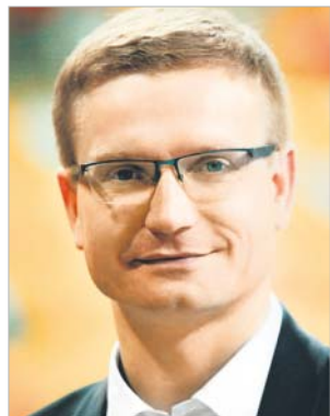
KRZYSZTOF MATYJASZCZYK prezydent Częstochowy

Modernizacja to jedno z kluczowych słów w samorządowej nomenklaturze, dlatego tytuł Modernizacja Roku brzmi dla samorządowców zachęcająco.