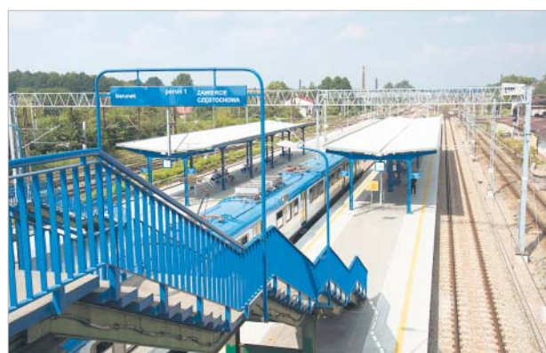
♦ Zmodernizowana linia kolejowa

Modernizację zajezdni prowadzono w formule „Zaprojektuj i wybuduj”. Zaprojektowanie obiektu odbyło się w oparciu o program funkcjonalno-użytkowy przygotowany przez zamawiającego.