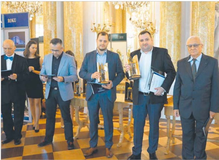
← Kategoria: Obiekty przemysłowo-inżynierskie. Nagroda dla EnerGOPOL Szczecin SA za modernizację toru wodnego Świnoujście – Szczecin (Kanał Piastowski i Mielński).