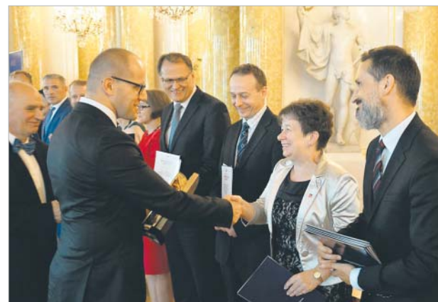
♦ Kategoria: Obiekt mieszkalne. Nagroda dla Szczecińskiego Towarzystwa Budownictwa Społecznego Sp. z o.o. za rewitalizację RAZEM – Rewitalizacja wnętrza apartamentu 23 ograniczonego ulicami Bohaterów Getta Warszawskiego, Królowej Jadwigi i Aleją Wojska Polskiego – Szczecin.