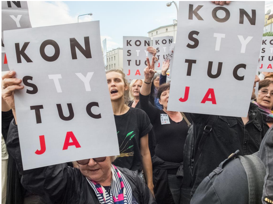
Demonstracja przed siedzibą rządzącej partii Prawo i Sprawiedliwość przeciwko przyjęciu ustaw ograniczających niezależność sądownictwa, 26 lipca 2017 r.