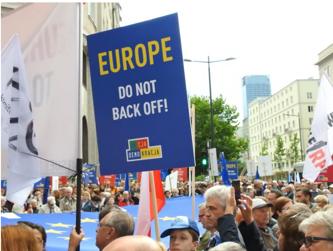
Protest przed budynkiem Przedstawicielstwa Komisji Europejskiej w Polsce, 25 czerwca 2018 r., nawołujący UE do dalszego wzywania Polski do przestrzegania rządów prawa.

Zgodnie z artykułem 19(1) Traktatu o Unii Europejskiej, w związku z artykułem 47 Karty Praw Podstawowych Unii Europejskiej, na państwa członkowskie, w tym na Polskę, nakłada się wymóg zagwarantowania prawa do skutecznego środka odwoławczego przed właściwym sądem wyższej instancji. Nowe postępowania dyscyplinarne dające nadmierne uprawnienia Ministrowi Sprawiedliwości oraz szczególna pozycja Izby Dyscyplinarnej Sądu Najwyższego 173 doprowadziły Komisję Europejską w kwietniu 2019 r. do wniosku, że Polska nie spełnia wymogów prawa UE. Komisja stwierdziła w szczególności, że Izba Dyscyplinarna Sądu Najwyższego nie jest organem niezależnym 174 .