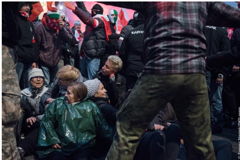
14 kobiet zaatakowanych podczas protestu na Marszu Niepodległości 11 listopada 2017 r.

Kilku wolontariuszy ze straży marszu próbowało ochraniać kobiety, jednak na miejscu nie było policji, by je ochraniać lub zaprowadzić porządek. Policja pojawiła się dopiero po ponad 30 minutach po zdarzeniu 224 . Po przybyciu, w wyniku wezwania przez kobiety, funkcjonariusze wylegitymowali je i pytali o powód obecności na marszu, sugerując prowokację z ich strony i umyślne ściągnięcie na siebie kłopotów. Policja nie przesłuchiwała żadnego z uczestników Marszu.