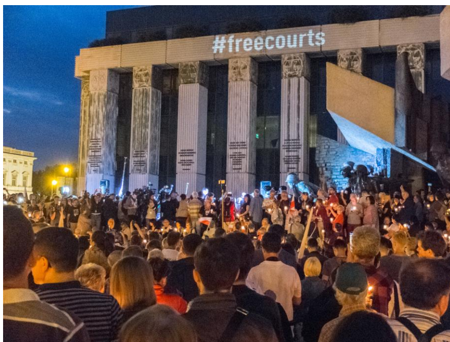
Protest przed Sądem Najwyższym w Warszawie, 16 lipca 2017 r.

We wczesnych godzinach porannych 26 kwietnia 2019 r. Sejm przyjął kolejną nowelizację ustawy o Sądzie Najwyższym. Nowelizacja wykluczyła możliwość wnoszenia odwołań od uchwał Krajowej Rady Sądownictwa, co oznacza brak możliwości rozpoznania odwołań złożonych przez trzech sędziów Sądu Najwyższego zmuszonych do przejścia na emeryturę, o których mowa wyżej 161 .