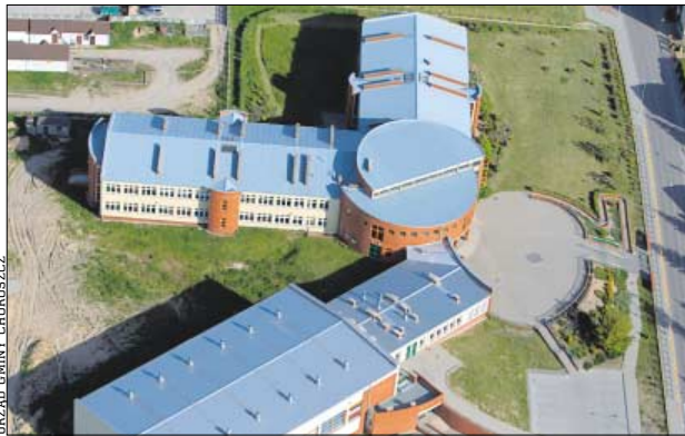
◆ Zespół Szkół w Choroszczy