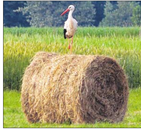
◀ Kładka turystyczno- -edukacyjna Śliwno - Waniewo

Włodarze gminy zapewniają także, że Choroszcz warto odwiedzić również zimą. W miejscowości Dzikie, we współpracy z Narwiańskim Ośrodkiem Narciarskim, opracowano nieznaną trasę dla miłośników nart śladowych.