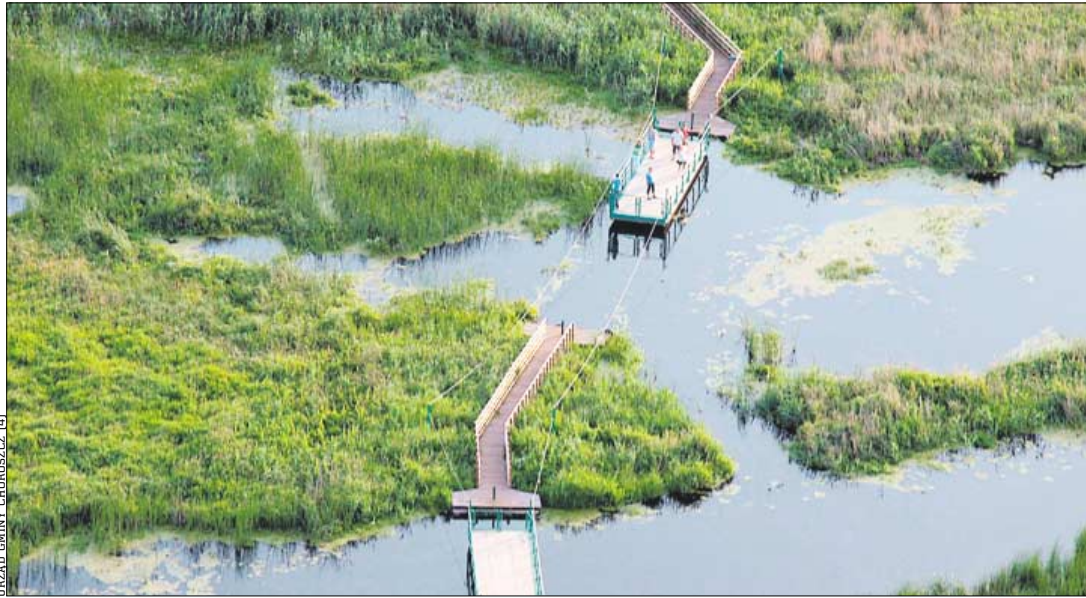
URZĄD GMINY CHOROSZCZ (4)

Gmina ma także propozycje dla tych, którzy wolą sporty wodne. Z myślą o nich wytyczono szlak kajakowy Spływ Narwią, który biegnie pomiędzy zaporą w Rybołach a mostem