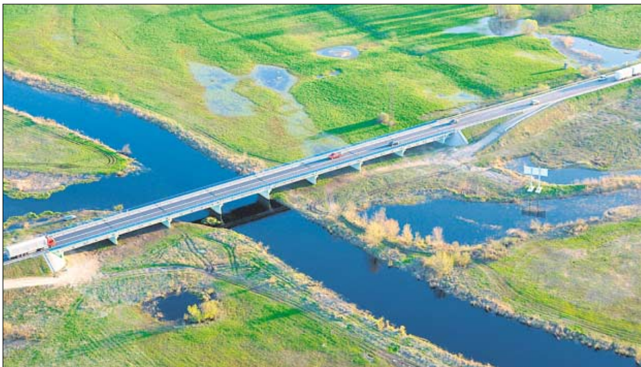
Droga krajowa nr 8 przecina gminę Choroszcz

Tereny te mają dostęp do sieci wodociągowej i energetycznej i częściowy dostęp do sieci gazowej, która jest systematycznie rozbudowywana. W dużej mierze są to również tereny skanalizowane lub takie, których kanalizację zaplanowano w najbliższych latach.