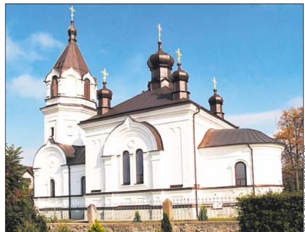
Cerkiew pw. Opieki Matki Bożej

Ale Choroszcz to także gmina historyczna. Do najcenniejszych zabytków należą m.in. późnobarokowy kościół pw. św. Jana Chrzciciela i św. Szczepana Męczennika z 1756 r. oraz położona przy kościele barokowa kaplica z XVIII wieku. Są tu też barokowy klasztor poddominikański z II połowy XVIII wieku i cerkiew prawosławna w stylu neobizantyjskim z II połowy XIX wieku, pw. Opieki Matki Bożej.