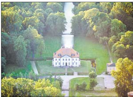
Letnia Rezydencja Branickich