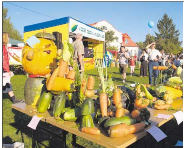
◀ Ogólnopolski Dzień Ogórka odbywa się zawsze w pierwszą niedzielę września na terenie szkoły w Kruszewie

Więcej informacji o imprezach Gminy Choroszcz na stronie internetowej http://kultura.choroszcz.pl oraz w wydawanym przez Miejsko-Gminne Centrum Kultury w Choroszczy dwumiesięczniku „Gazeta w Choroszczy” ( www.gazeta.choroszcz.pl ) publikującym także w sieci internetowej ciekawostki, aktualności i program kulturalny.