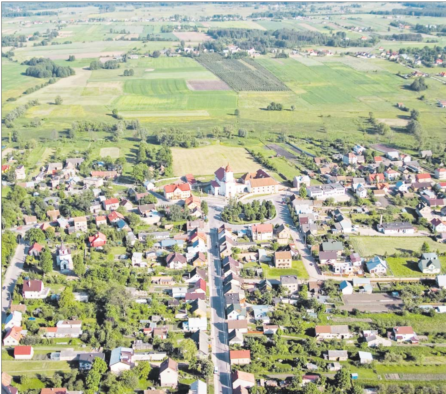
♦ Panorama miasta z widokiem na kościół w Choroszcz