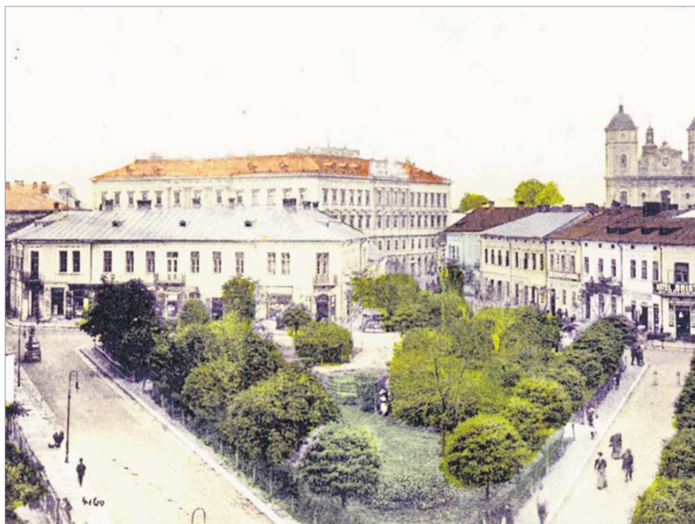
♦ Stanisławów. Plac Mickiewicza. Ta i inne pocztówki ze zbiorów Muzeum Niepodległości