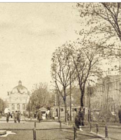
♦ Żółkiew. Brama Sobieskiego ♦ Lwów. Pomnik Sobieskiego