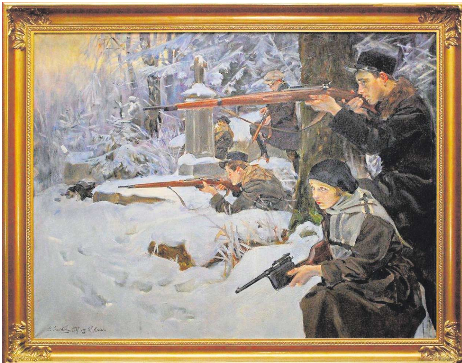
„Obrona Lwowa” Wojciech Kossak, kopia Anna Suwata, ze zbiorów Muzeum Niepodległości w Warszawie