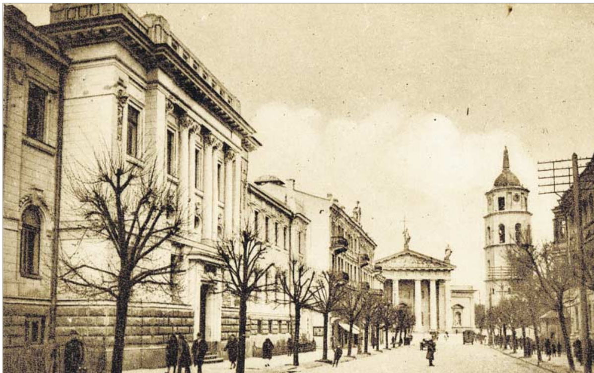
• Wilno. Ulica Adama Mickiewicza