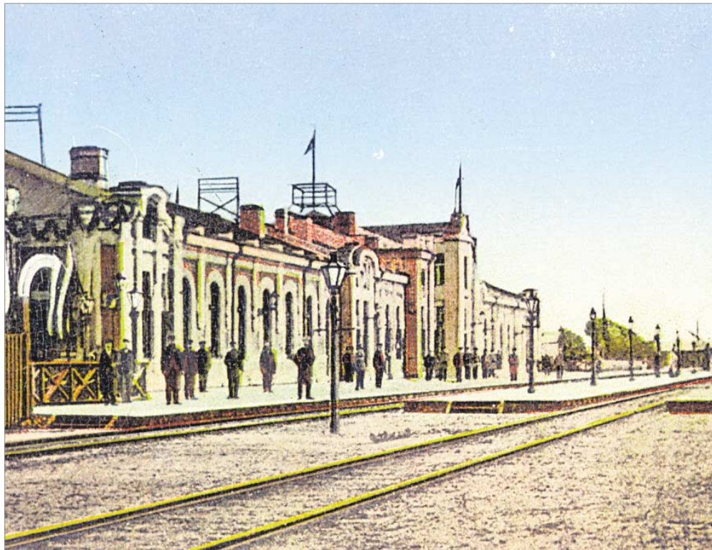
♦ Lida. Dworzec Mikołajewski