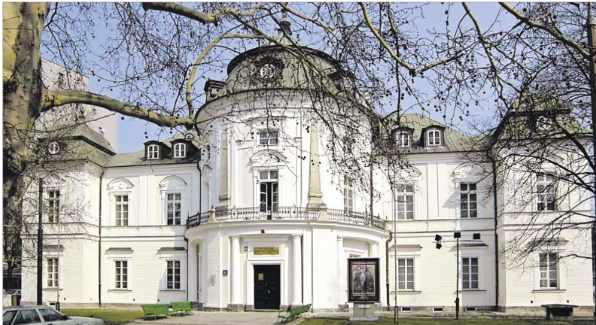
• Siedziba Muzeum Niepodległości w Warszawie