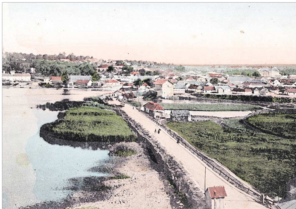
♦ Podwoczyzka widok ogólny, granica

Ze względu na bardzo duże zainteresowanie i pozytywną ocenę Spotkań, na początku 2010 roku Muzeum Niepodległości przystąpiło do przygotowania II Muzealnych Spotkań z Kresami. W odpowiedzi na zaproszenie zgłosiło swoje uczestnictwo 35 pracowników merytorycznych z 19 instytucji.