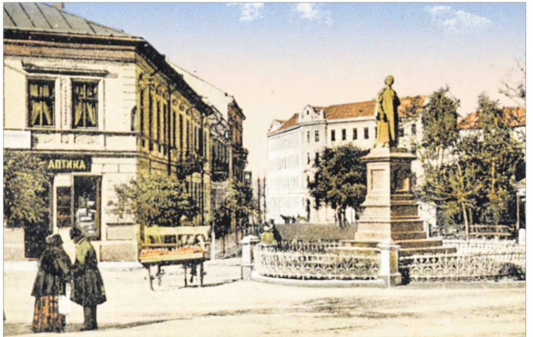
↑ Tarnopol. Ulica Świętojańska