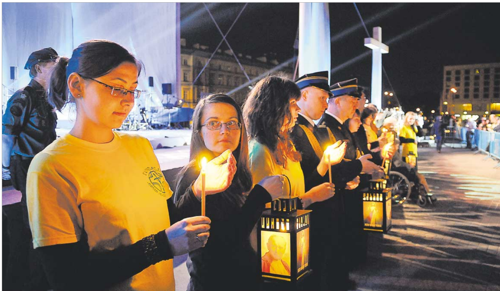
✦ Jedną z akcji podopiecznych fundacji była w 2011 r. Beatyfikacyjna Iskra Miłosierdzia – młodzi w specjalnych lampionach przekazywali płomień z tagiewnickiego sanktuarium do instytucji oraz kościołów. Na zdjęciu czuwanie na pl. Piłsudskiego w Warszawie