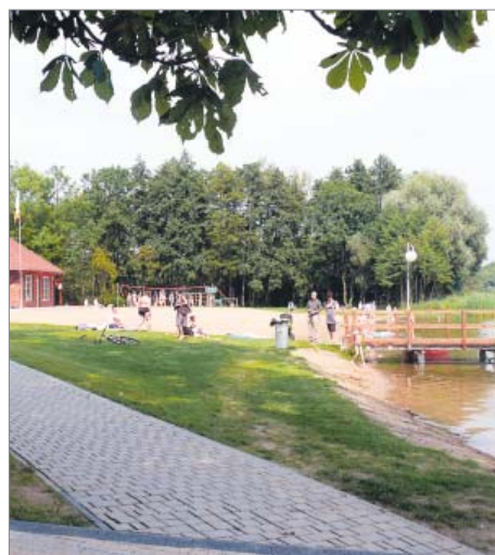
Rewitalizacja kąpieliska w Moryniu