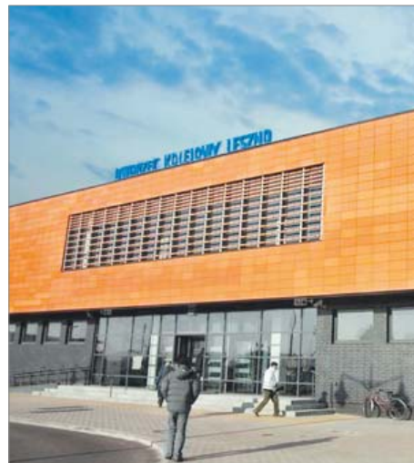
Modernizacja dworca PKP w Lesznie