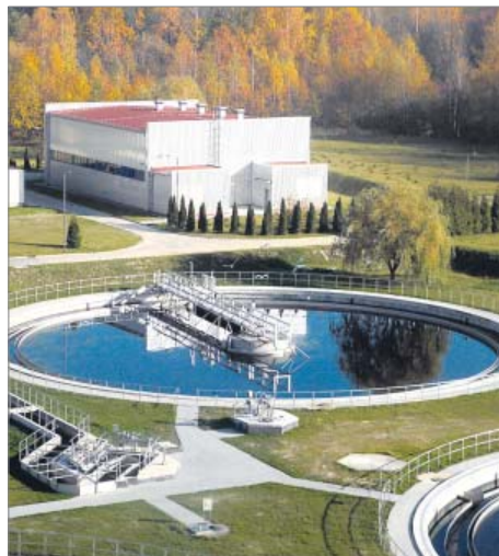
Modernizacja oczyszczalni ścieków Chorzów-Klimzowiec, ul. Gałeczki