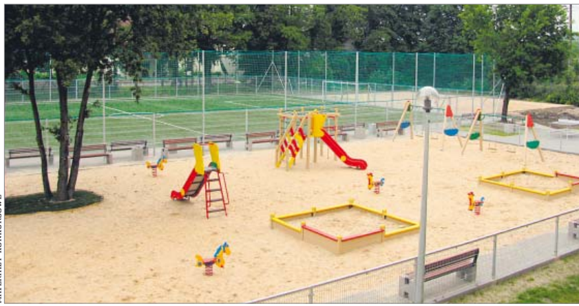
Obok niektórych boisk powstały estetyczne, kolorowe place zabaw

Władze powiatu poznańskiego uznały, że pora bicia na alarm już minęła. Nadszedł czas, by podjąć radykalne działania. I rzeczywiście te działania zostały podjęte – wyremontowano szkolne boiska