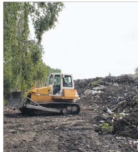
Rewitalizacja składowiska odpadów w Czerniejewie