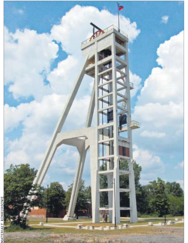
Na szczycie ma zostać otwarta platforma widokowa