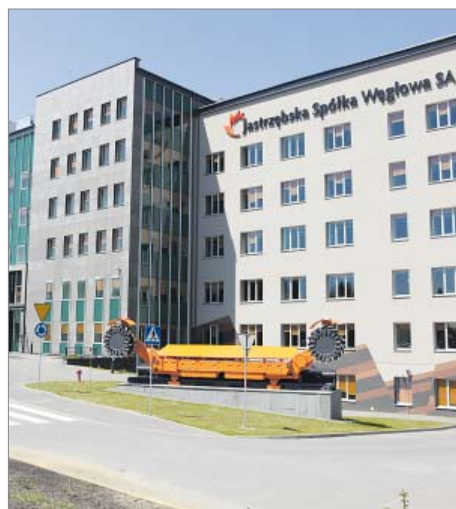
Modernizacja siedziby Jastrzębskiej Spółki Węglowej, Jastrzębie-Zdrój, aleja Jana Pawła II 4