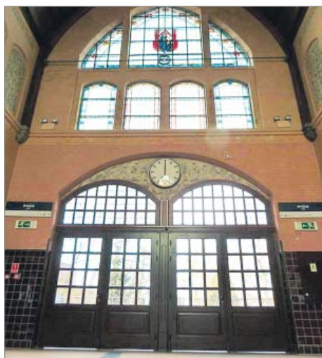
Modernizacja dworca PKP w Iłwowie