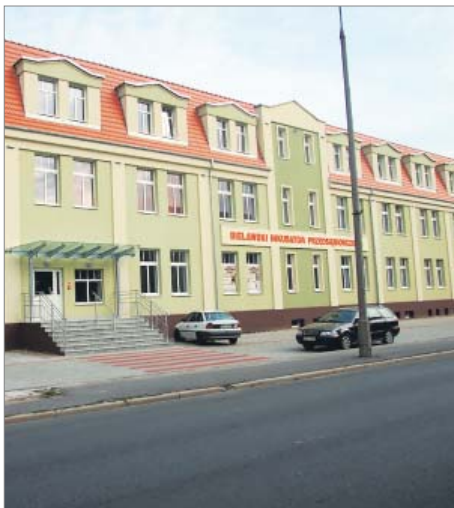
Modernizacja budynku Bielawskiego Inkubatora Przedsiębiorczości w Bielawie, ul. Wolności 24