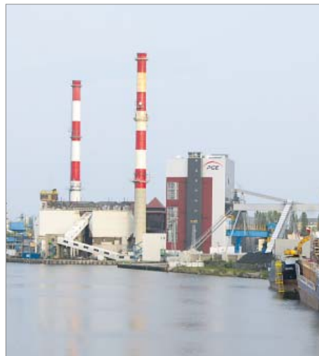
Modernizacja elektrowni Dona Odra w Szczecinie