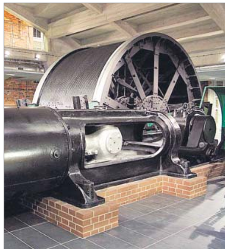
Rewitalizacja Parku Tradycji Górnictwa i Hutnictwa w Siemianowicach Śląskich przy ul. Orzeszkowej 12