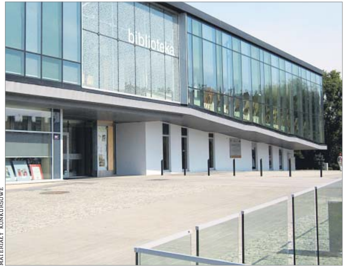
Nowoczesna biblioteka stała się miejscem życia kulturalnego Chrzanowa