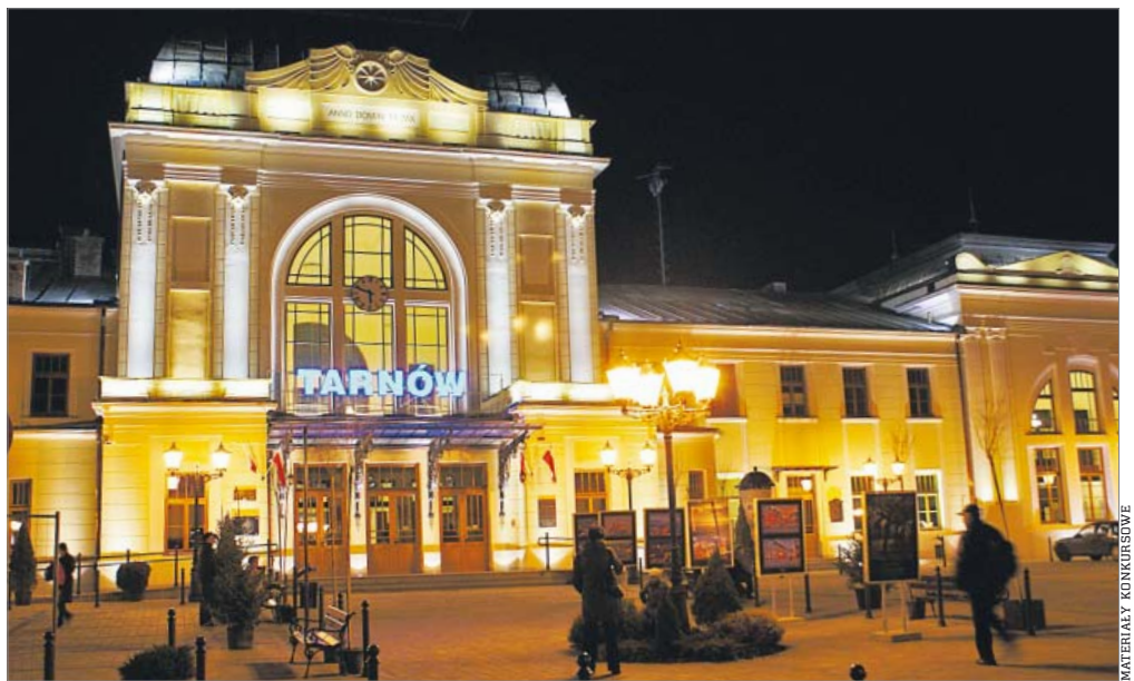
A tak wygląda dziś, cieszy oczy mieszkańców i przyjezdnych