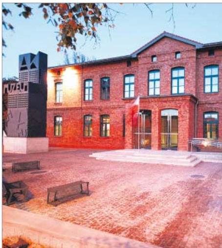
Adaptacja budynku na Muzeum Armii Krajowej w Krakowie, ul. Wita Stwosza 12