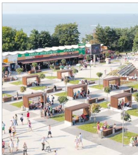
Modernizacja „Promenady Gwiazd” w Międzyzdrojach