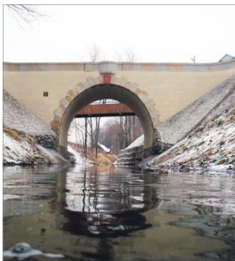
Modernizacja zabytkowego mostu nad Potokiem Iwonickim na drodze Krosno – Rogi – Iwonice