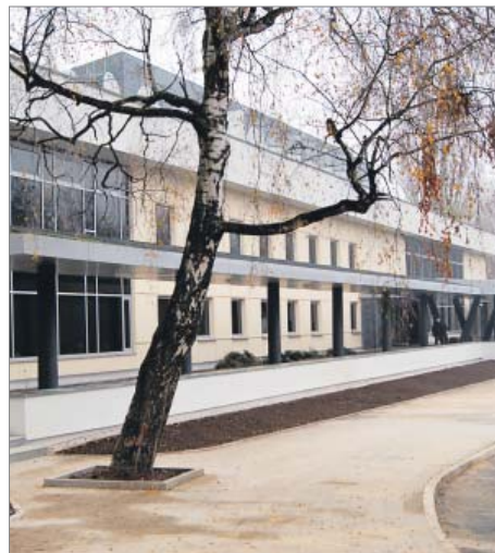
Modernizacja Kutnowskiego Domu Kultury