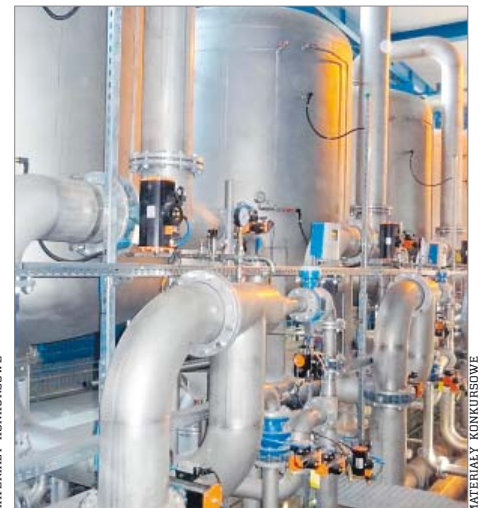
Modernizacja stacji uzdatniania wody „Leśna” w Zabrzu, ul. Leśna 135