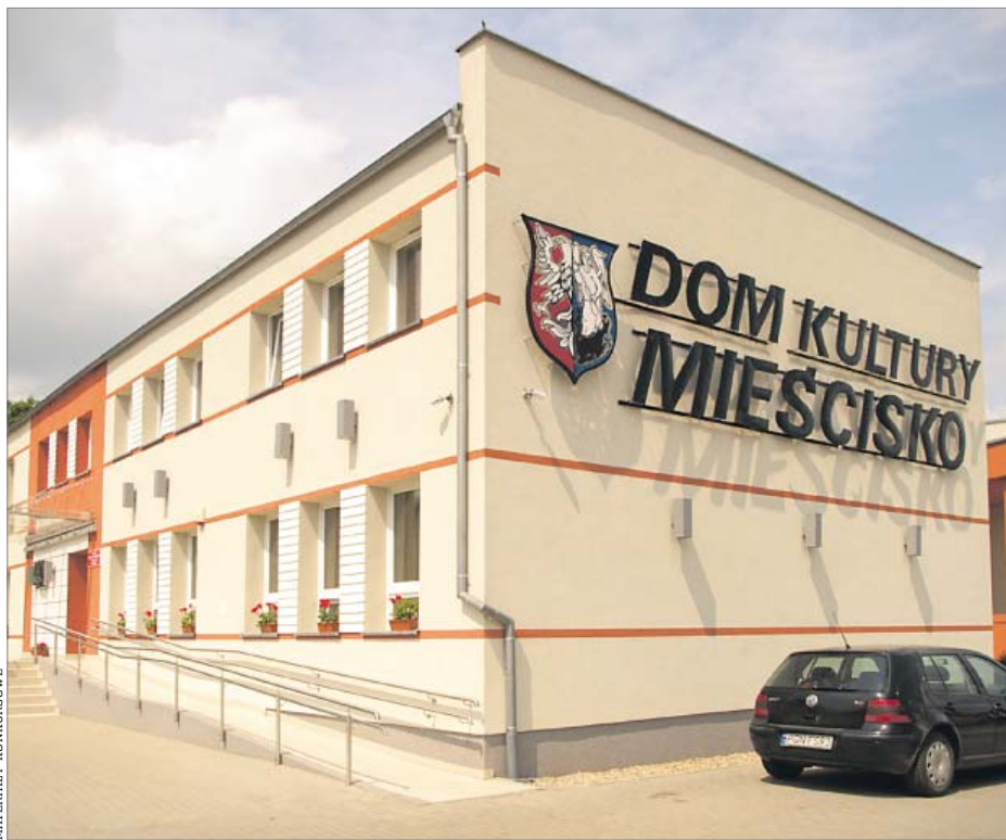
Zmodernizowany Dom Kultury w Mieścisku

Jego głównym celem jest właśnie inicjowanie i propagowanie działań służących ochronie narodowego dziedzictwa kultury materialnej w Rzeczypospolitej Polskiej, promowanie rozbudowy, przebudowy i modernizacji obiektów i urządzeń dla uzyska-