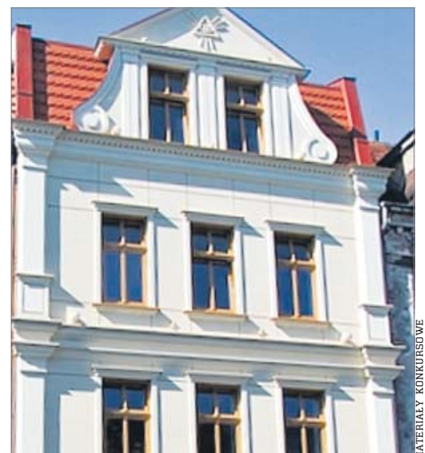
Modernizacja budynku handlowo-usługowo-mieszkalnego w Kaliszu przy ul. Przechodniej 6