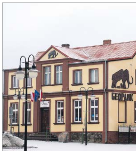
Modernizacja i adaptacja budynku starego kina na regionalne Biuro Geoparku