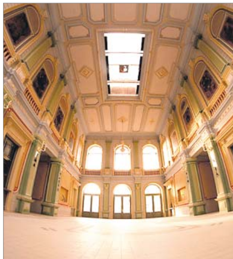
Modernizacja dworca PKP w Przemyślu