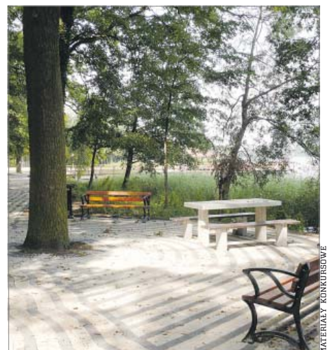
Rewitalizacja parku miejskiego i terenów zielonych „Promenada Wielkiego Raka” w Moryniu