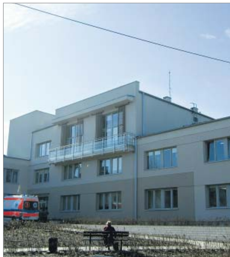
Modernizacja przychodni zdrowia w Błoniów, ul. Piłsudskiego 2/4