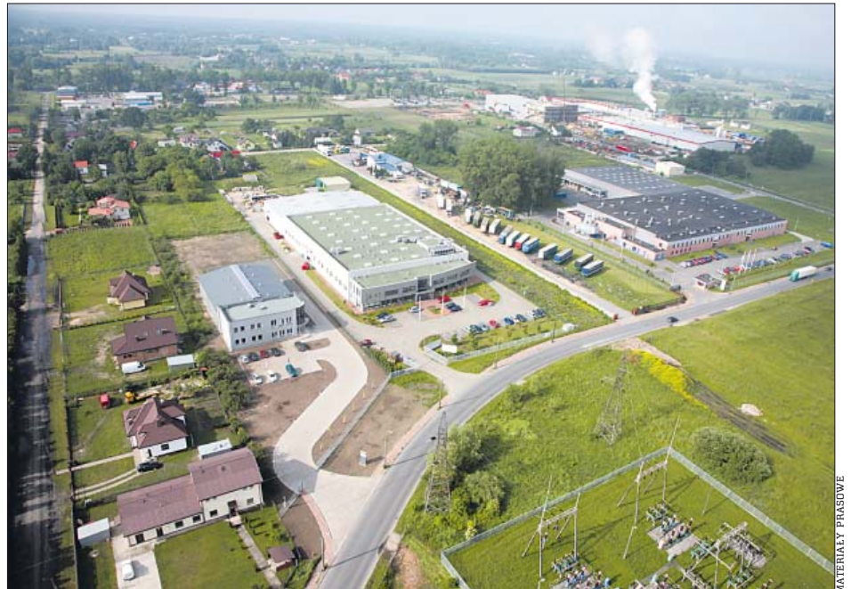
♦ Strefa przemysłowa